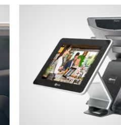
Visores para clientes en diferentes versiones (opcional)