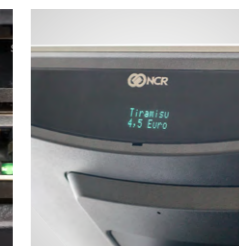
Display de clientes 2x20 elegantemente integrado (opcional)