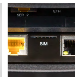
Conexión directa a la nueva Antena Orderman sin fuente de alimentación (PoE) (opcional)