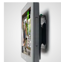
Apto para montaje de sobremesa y en la pared (VESA)

Infórmese ahora en su distribuidor Orderman o en oficinaiberica@orderman.com .