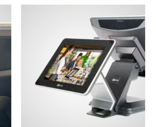
Écrans clients dans plusieurs modèles (option)