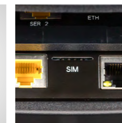
Connexion directe à la nouvelle antenne Orderman OMB4 sans alimentation électrique additionnelle (PoE) (option)