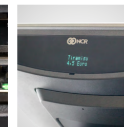
Afficheur client 2x20 intégré (option)