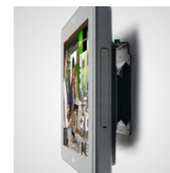
Pour montage au comptoir ou mural (VESA)

Demandez des informations à votre partenaire Orderman ou en envoyant un message à sales@orderman.com .